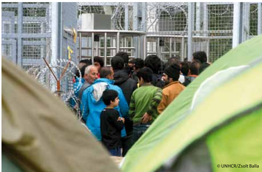
Mai 2016: Hunderte Flüchtlinge harren über Tage oder gar Wochen hinweg vor der Transitzone bei Röszke aus. Für lediglich 15 Personen pro Tag öffnet sich die Tür.