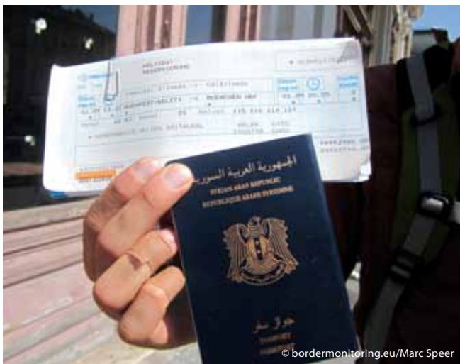
Links: 1. September 2015: Trotz Ticket und anderslautender Versprechungen kommt kein Flüchtling mehr in den Bahnhof.