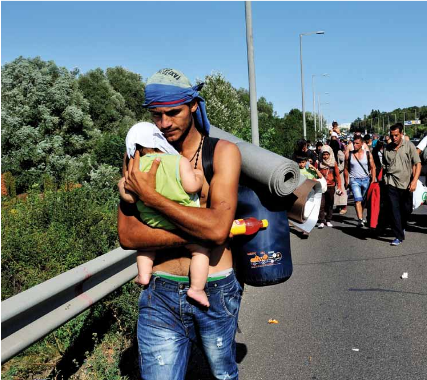
Oben: Am 4. September 2015 laufen die Flüchtlinge auf der Autobahn Richtung Wien.