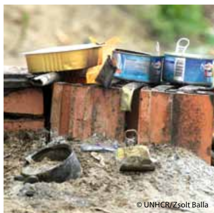
Im informellen Lager vor der Transitzone wird Holz gesammelt um auf improvisierten Feuerstellen Essen zu erwärmen.