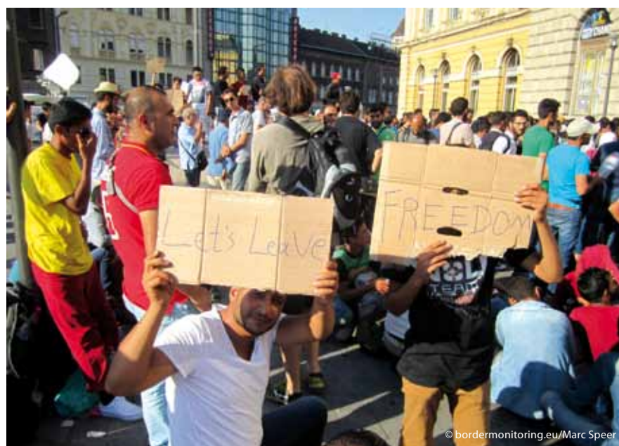
Ganz oben: Am 5. September im Bahnhof Keleti. Oben: Protest vor dem Bahnhof Keleti.

„DAS PROBLEM IST KEIN EURO- PÄISCHES PROBLEM. DAS PROBLEM IST EIN DEUTSCHES PROBLEM.“