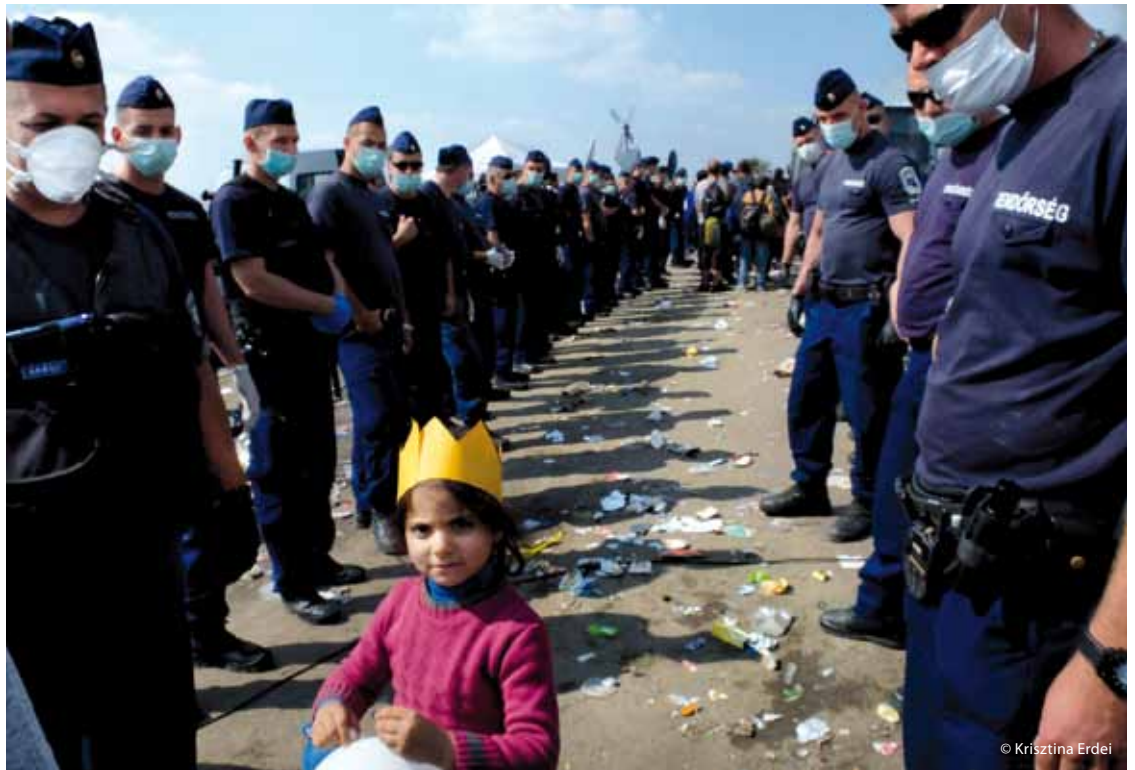
Flüchtlingsmädchen in Röszke bevor der Zaun zu Serbien endgültig fertiggestellt wurde.

Im Regelfall werden Personen, die beschuldigt werden, den Zaun überwunden zu haben, bis zu 72 Stunden auf der Polizeiwache in Szeged festgehalten und innerhalb weniger Tage dem Gericht vorgeführt. Familien werden normalerweise getrennt. In der Mehrheit der Fälle erfolgt eine Verurteilung zu einer ein- bis zweijährigen Ausweisung aus dem Schengenraum. Erfolgt im Anschluss an das Urteil eine Asylantragstellung, werden alleinstehende Männer in der Regel in Asylhaft überstellt, wird kein Asylantrag gestellt, erfolgt eine Überstellung in die Abschiebehaft.