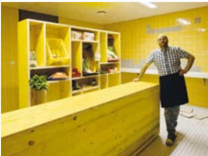
Prototyp einer Shop-Einrichtung zur Unterstützung der Gemeinwohl-Ökonomie

Durch eine bereits initiierte Zusammenarbeit mit dem „Mobilen Stadtlabor“ der Technischen Universität Wien, das als temporäre Architektur im Entwicklungsgebiet St. Marx unweit des „Hauses Erdberg“ für die nächsten Jahre Quartier bezogen hat, könnte eine erste Außenstelle für die Tauschwährung etabliert werden. Im „Mobilen Stadtlabor“ sollen Wissens- und Veranstaltungsräume, eine Radwerkstatt und Community-Gärten entstehen, in denen Studierende, zivilgesellschaftliche Initiativen und StadtbewohnerInnen gemeinsam ein Experimentierfeld für alternative Stadtproduktion als „Open University“ eröffnen und so einen Ort schaffen, an dem Wissen geteilt werden kann. Kochkurs gegen Sprachunterricht, Fahrradreparatur gegen selbstgezogenes Gemüse. Die Palette der Möglichkeiten ist vielfältig und bildet für die BewohnerInnen des „Hauses Erdberg“ eine wichtige Erweiterung in die Nachbarschaft.