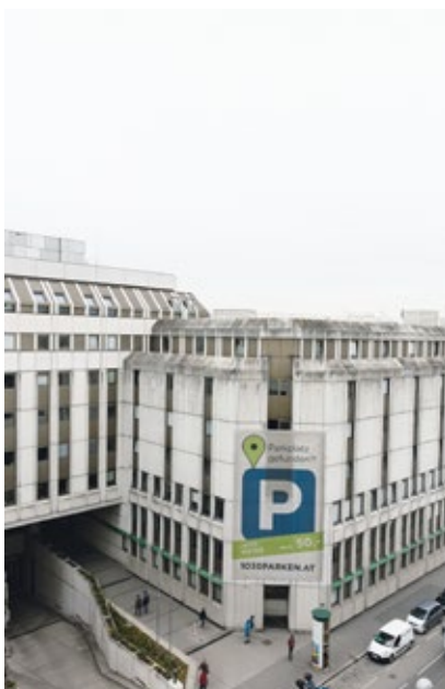
Eingang zu dem 56,000 m 2 großen Gebäudekomplex in der Erdbergstraße

Das ursprünglich als kurzfristiges Übergangsquartier für Flüchtlinge zur Entlastung der Asylerrstaufnahmestelle im rund 35 Kilometer entfernten Traiskirchen eingerichtete „Haus Erdberg“ hat die Stadt Wien Anfang Dezember 2015 von der Bundesverwaltung zur langfristigen Nutzung übernommen. Fast wie Ironie mutet es an, dass just ein ehemaliges Haus der Zollwache zur Unterkunft für Asylsuchende wird, dessen angestammte Funktion durch die Grenzöffnungen im vereinten Europa obsolet geworden war, während gleichzeitig wieder Zäune an den Grenzen errichtet werden.