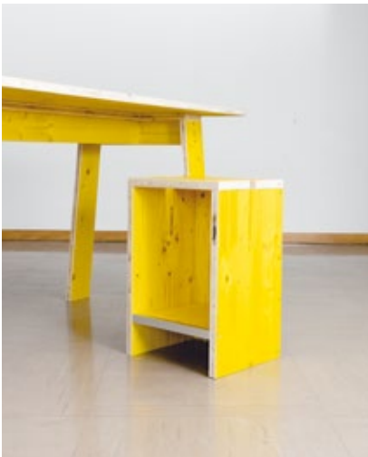
Hoher Tisch SF 02 und Hocker SF 05, die in der Küche zur Vorbereitung und zum Genuss der Mahlzeiten eingesetzt werden

Inspiration für die konkreten Designs im anlässlich der Architektur-Biennale auch als Publikation erscheinenden „Social Furniture“-Katalog haben EOOS u. a. in den Büchern von James Hennessey und Victor Papanek gefunden, die in den 1970er-Jahren mit „Nomadic Furniture I + II“ zerlegbare Do-it-yourself-Möbel für einen nachhaltigen und mobilen Lebensstil entworfen hatten. Wie in vielen Projekten fokussieren EOOS auch im „Haus Erdberg“ außer auf die punktgenaue Analyse des konkreten Bedarfs vor Ort auf die Reproduzierbarkeit der Maßnahmen und ihre Anwendbarkeit in unterschiedlichen Kontexten.