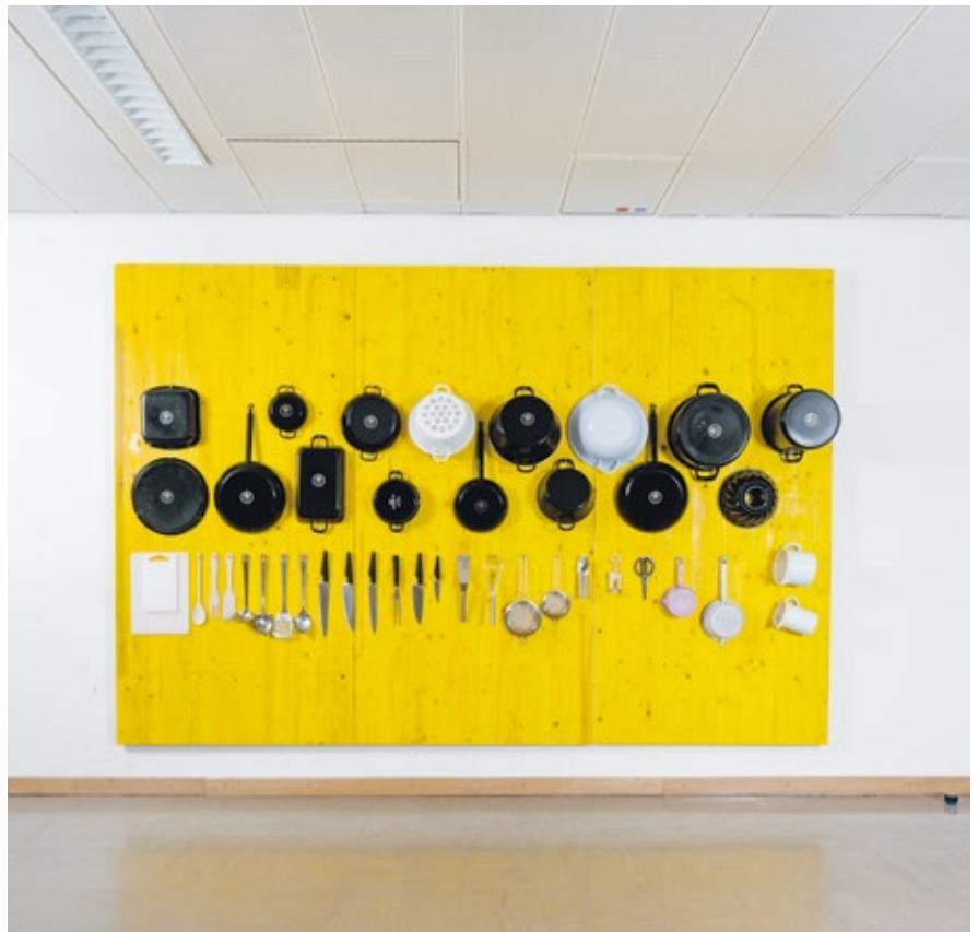
Küchenwand SF 09