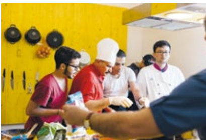
Erstes Kochevent in der neu eingerichteten Gemeinschaftsküche mit Elementen aus dem Katalog „Social Furniture“ von EOOS im Haus Erdberg

Bereits bei der Entwicklung der 2008 lancierten „Küchenwerkstatt b2“ für bulthaupt, die im Design Labor des Museums für angewandte Kunst in Wien zu besichtigen ist, haben sich EOOS intensiv mit dem Thema Kochen auseinandergesetzt. Im Zentrum der vielfach ausgezeichneten „Küchenwerkstatt b2“ steht ein zweitüriger Schrank, der aufgeklappt wie ein Küchentriptychon wirkt und wohlgeordnet Raum für alle notwendigen Kochutensilien, Küchenwerkzeuge und das Geschirr enthält. Die Werkstattküche ist ein typisches Beispiel für die Arbeiten von EOOS, in denen es immer auch um eine Rückführung auf das Wesentliche, um das Freilegen von Funktion und Nutzung geht. Drei Jahre dauerten Recherche und Entwicklung der modularen „b2“, die aus einfachen mobilen Elementen besteht: aus einem Küchenwerkzeugschrank, einer Küchenwerkbank mit Herdplatte und Spülbecken und einem Geräteschrank für Kühlschrank, Geschirrspüler und Backrohr. Übersicht, Ordnung und Funktionalität sind Begriffe, die man mit der Werkstattküche in Verbindung bringt – und Toleranz, denn die Designobjekte von EOOS wollen ihren UserInnen keine strikte Nutzung vorgeben; eher sprechen sie eine Einladung zur spielerischen Aneignung aus.