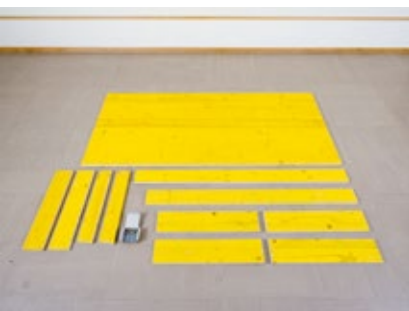
Komponenten des Tisches SF 02

Arbeit ist eines der Schlüsselthemen in Fragen der Inklusion von Flüchtlingen. Als bestimmender Faktor für soziale Sicherheit und gesellschaftliche Anerkennung kommt ihr ein hoher Stellenwert in der Gestaltung eines gelungenen Lebens zu. Für Menschen in Grundversorgungsunterkünften, die per Gesetz zwar nicht länger als sechs Monate, in der Praxis aber oftmals bis zu mehreren Jahren auf ihren Asylbescheid warten müssen, bedeutet Arbeit vor allem Beschäftigung und Ablenkung, um der Monotonie des Alltags zu entfliehen. Daneben kann durch die Erledigung anfallender Arbeiten in organisierten Quartieren wie dem „Haus Erdberg“ ein klein wenig Geld zum knappen Taschengeld von vierzig Euro dazuverdient werden: pro Monat maximal einhundert Euro „Remuneration“ für 25 Stunden Gemeinwohlarbeit in der Unterkunft. Betreuungsorganisationen wie die Caritas bieten daher an, notwendige Dienstleistungen, die ansonsten extern vergeben werden müssten, auf freiwilliger Basis an die Bewohner im Haus abzugeben. Eine willkommene Möglichkeit der Beschäftigung, die in der österreichischen Asylgesetzgebung anders als in der deutschen Gesetzeslage glücklicherweise verankert ist.