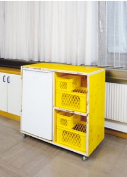
Mobiles Element SF 11 für die Zimmer zur Unterstützung der Selbstversorgung