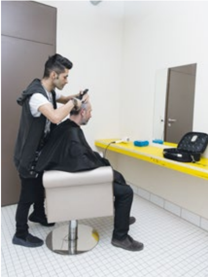
In einem ungenutzten Teil des Gebäudes wurde ein Friseursalon eingerichtet.

machen, Workshops mit externen ExpertInnen die Wissenspalette erweitern. Die Idee einer Food-Coop und damit der Möglichkeit eines gemeinsamen Großeinkaufs und der kostengünstigen Weitergabe von Lebensmitteln ohne Gewinnabsicht, wie sie in vielen Städten zahlreich praktiziert wird, könnte ein weiteres Element bilden, um mit den knappen SelbstversorgerInnenbudgets ein besseres Auskommen zu finden.