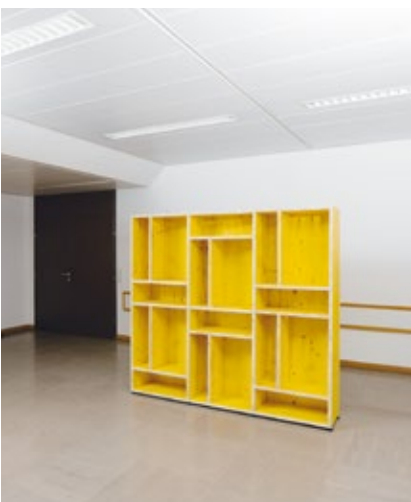
Shop Regal SF 15 aus dem Katalog Social Furniture

Ganz im Zeichen der Selbstermächtigung steht auch das Anlegen von zwei großen Hochbeetfeldern im Innenhof des „Hauses Erdberg“. Unterstützt durch das Know-how der österreichischen Landschaftsarchitektin Maria Auböck, die gemeinsam mit ihrem Partner János Kárász für die Gestaltung des Innenhofs des österreichischen Pavillons bei der Architektur-Biennale 2014 verantwortlich zeichnete, werden Subsistenzgärten angelegt, um die Selbstversorgung zu unterstützen und attraktive Freiräume zu schaffen. 45 Tonnen Erde, 32 Tonnen Rundkies und vierhundert Quadratmeter Filtervlies braucht es, um die beiden Hochbeete zu füllen. Die in Wien gewonnene Erde ist aus Garten- und Küchenabfällen entstanden, die von der MA 48, der Abfallwirtschaftsabteilung der Stadt Wien, gesammelt und lokal zu hochwertigem Kompost recycelt werden. Mit ihrem Einsatz als Nährboden zum Ziehen von Gemüse im „Haus Erdberg“ entsteht ein perfektes Beispiel für eine ökologisch und sozial nachhaltige Biokreislaufwirtschaft. Mit 2.200 Gemüsesetzlingen, die in der ersten Pflanzphase angebaut werden, schafft die Hofbegrünung nicht nur Möglichkeiten zur Erweiterung des Nahrungsangebots, sondern auch sinnstiftende Beschäftigung und einen Raum für Kommunikation und gemeinschaftliches Miteinander. Für die Kinder, die ab Sommer 2016 im Haus leben werden, wird der Hofgarten als geschützter Aufenthaltsbereich im Freien zu einer wichtigen Ressource als Bewegungsraum und Spielplatz.