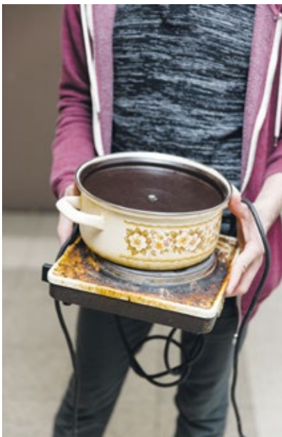
Aufgrund der Feuermelder und unzureichender elektrischer Kapazitäten ist Selbstversorgung in den Zimmern verboten.

„Was wir hier tun, ist, an gesellschaftlichen Alternativen zu forschen und mit Möglichkeiten einer anderen Gesellschaft zu experimentieren. Letztendlich geht es uns darum, an Utopien zu arbeiten, die eine kollektive Veränderung bewirken.“