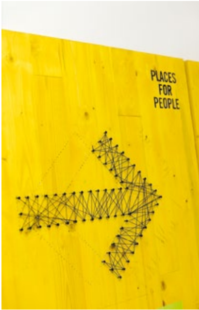
Leitsystem Prototyp SF 17

weit über die Betrachtung der aktuellen Situation hinausreicht. EOOS beschäftigen sich immer auch mit dem Freilegen von Wurzeln in der Vergangenheit, machen sich auf die Suche nach intuitiven Bildern, nach Mythen und Ritualen, die dem menschlichen Verhalten eingeschrieben sind und nach wie vor dazu dienen, soziale Prozesse zu organisieren.